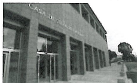
L'ingresso della Casa di Cura di San Rossore