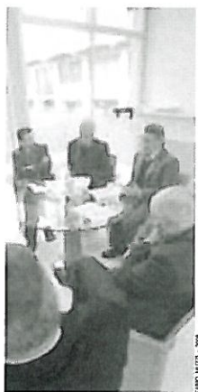
Dirigenti della clinica e di Mps